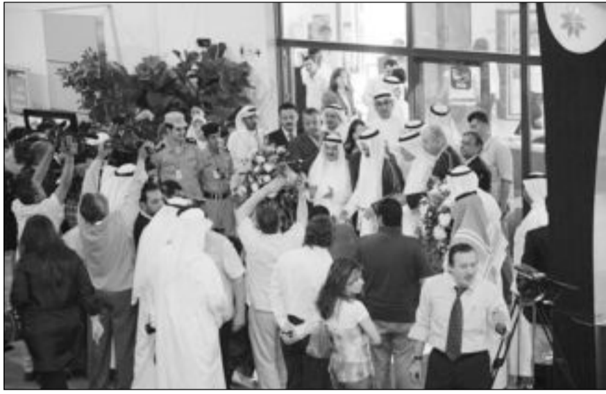
لقطة من معرض العقار في دورة 2009